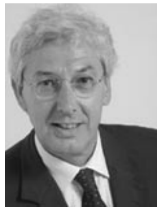
On. Renzo Innocenti, Vice Presidente Gruppo Ds-l'Ulivo alla Camera dei Deputati

Il gruppo parlamentare dei Democratici di Sinistra facendosi interprete di questa legittima e giusta richiesta di risarcimento sta continuando a sollecitare il Governo italiano perché si interessi della vicenda. Abbiamo anche presentato una proposta di legge per la concessione di un indennizzo simbolico e per l'istituzione di un Fondo che finanzia iniziative e progetti volti alla conservazione della memoria, alla testimonianza ed alla ricerca storica, al fine di prevenire il ripetersi di simili ingiustizie per il futuro.